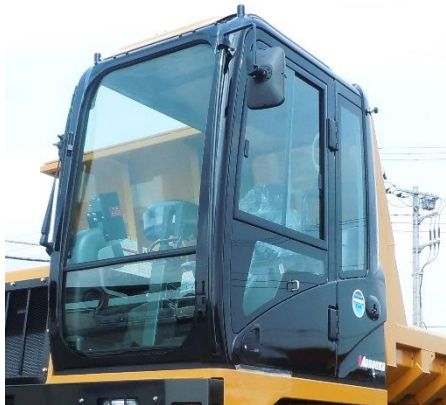
★視認性・居住性抜群の デラックスキャビン