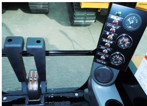
★好評な2本レバーと 充実したモニター類