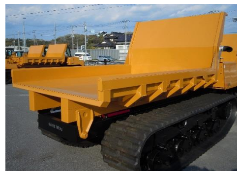
★スクープエンド荷台